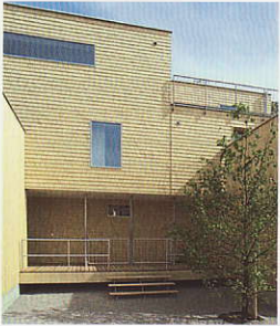
Figur 142: Kubische Architektur mit Bucher-Biosphären- Schindeln

Objekt: Mehrfamilienhaus Lindenbühl im Minergie-Standard, Dietikon (Architekt Reto Brawand, Zürich)